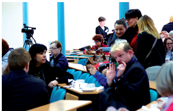
Uczestnicy konferencji podczas przerwy